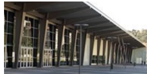
PAVILHÃO DR. MÁRIO MEXIA COIMBRA